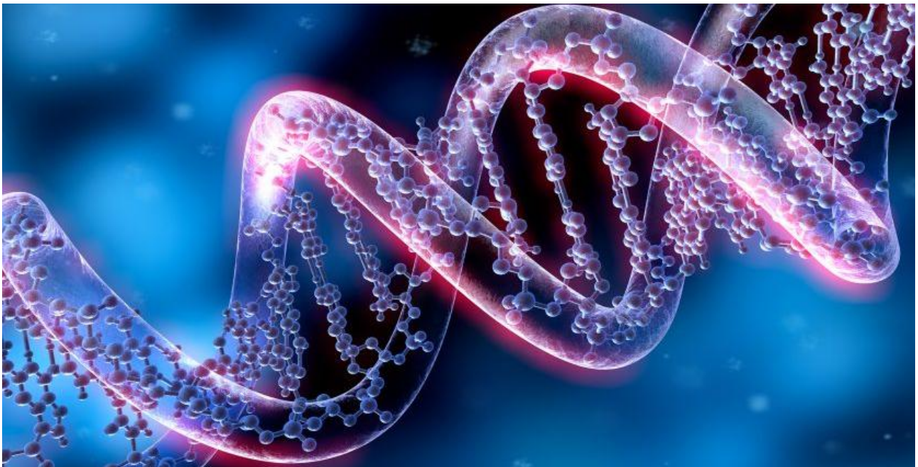
Her ses gener i DNA fotograferet i et elektronmikroskop.

I både flyve og avlsslaget, vil den faktiske værdi af duerne kun blive vist gennem at teste dem, enten i kapflyvning eller ved kvaliteten af de unger der avles. Den ægte test af en kvalitetsavler, er hvad dens unger præsterer både i kapflyvning og avl, men det er ikke nødvendigvis avlsduens egne resultater. Kan en avlsdue ikke producere unger mindst lige så gode som den selv eller bedre, har duen ingen værdi og bør fjernes. Man bør dog lige i den forbindelse huske, at et år er som regel ikke nok som målestok, men efter 2 år er evalueringen mere sikker.