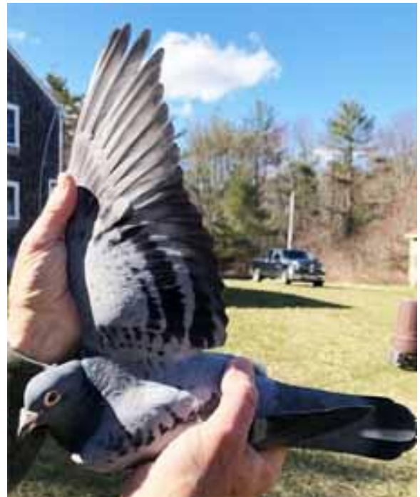
Billeder fra Franks slag og en superdue med udbredt vinge.

Frank sendte desværre ikke flere billeder