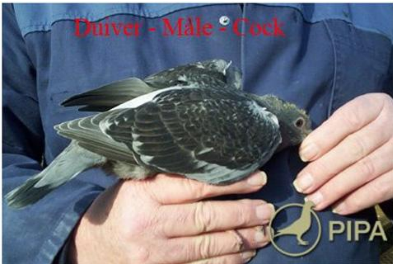
Dette er en hanunge