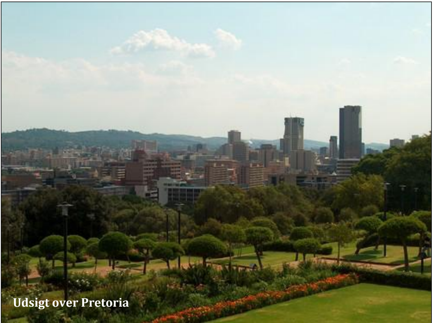
Udsigt over Pretoria