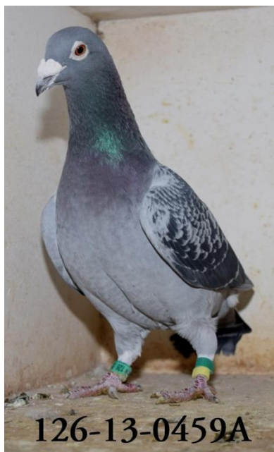
Duer fra I&J Kristensen 126 Løgstør