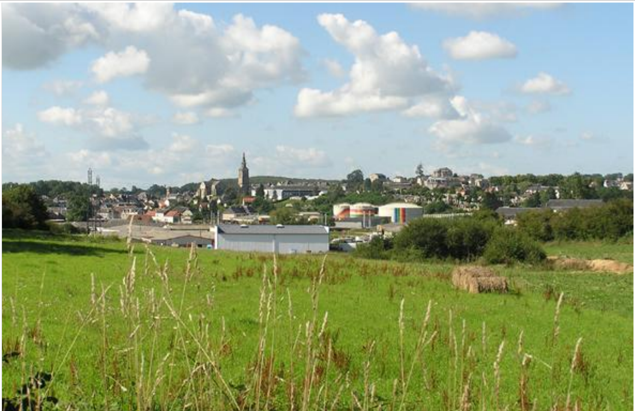
Øverst La Souterraine by og nederst oversigt over det frodige landskab.