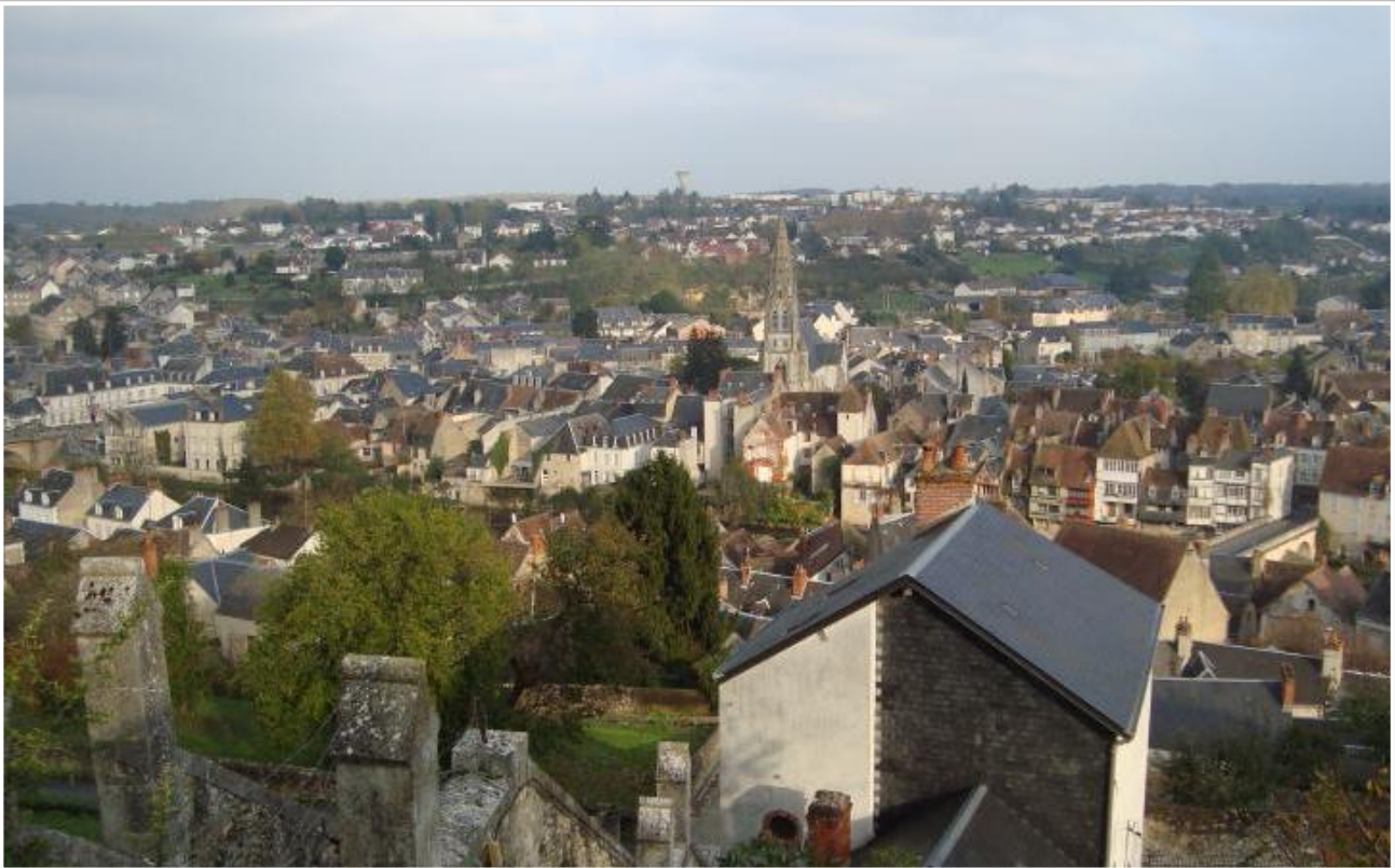
Øverst Argenton by og nedrst vinmarker fra egnen.