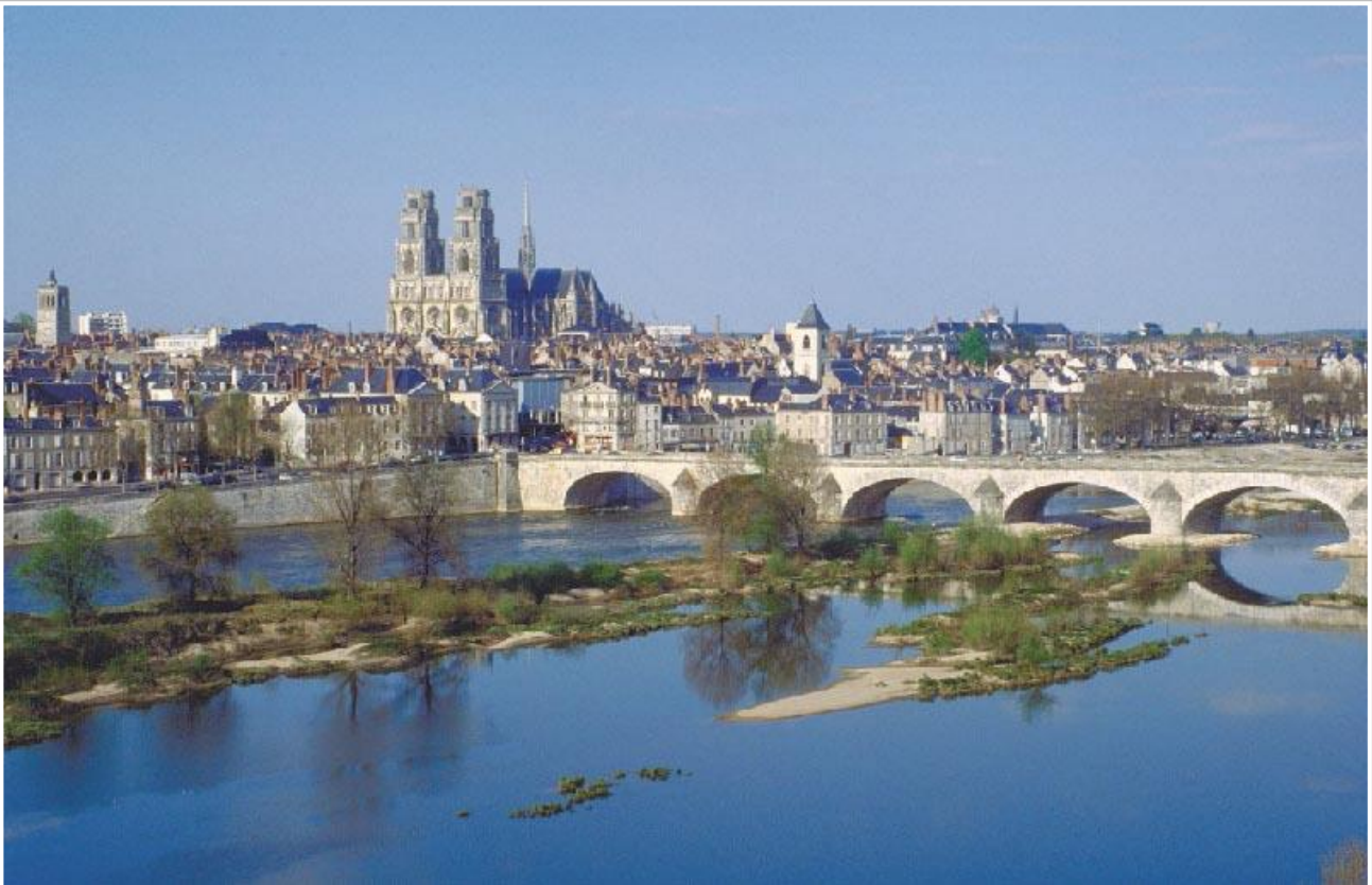
Øverst Orléans by og nederst landskab syd for Orléans.